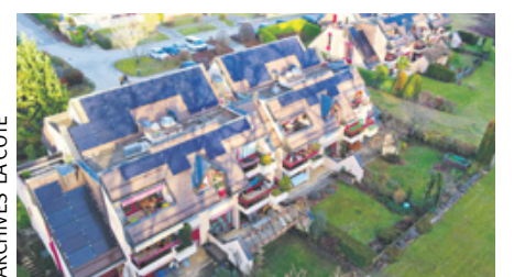
ARCHIVES LA CÔTE

L'énergie durable séduit les proprios selon une étude. P15